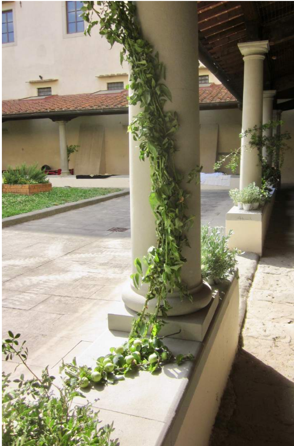
Chiostro della Biblioteca Colonne decorate con rami di mirto, melo, rose rampicanti, edera, convolvolo