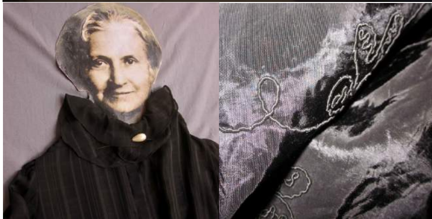
Foto nel backstage: volto dipinto da Silvia Bibbo; prove di allestimento con broccato nero