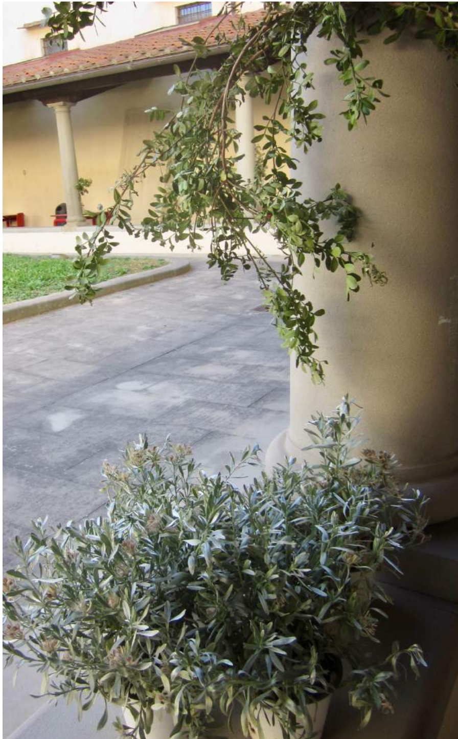
Chiostrò della Biblioteca Pietro Thouar