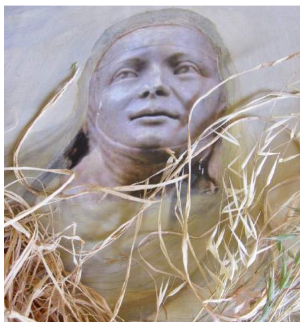
Foto del Backstage: prove di allestimento con il ritratto di Margherita di Brabante realizzato dalla pittrice Silvia Bibbo