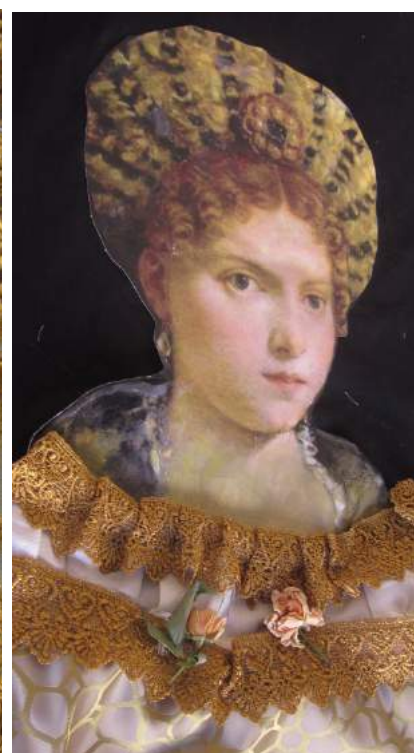
Foto del Backstage gonna in broccato, applicazioni di pizzo e rose antiche disseccate