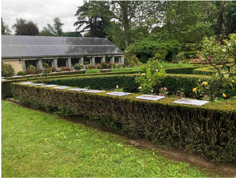
Serre Torrigiani, labirinto nel Giardino all'italiana. Panoramica dell'allestimento diffuso tra varie siepi