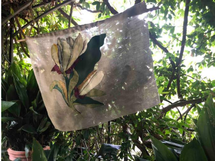
Silvia Zambarbieri, Giglio. Tecnica mista su tela, 2021 Fiore bianco in raso, cotone dipinto, foglie in cotone