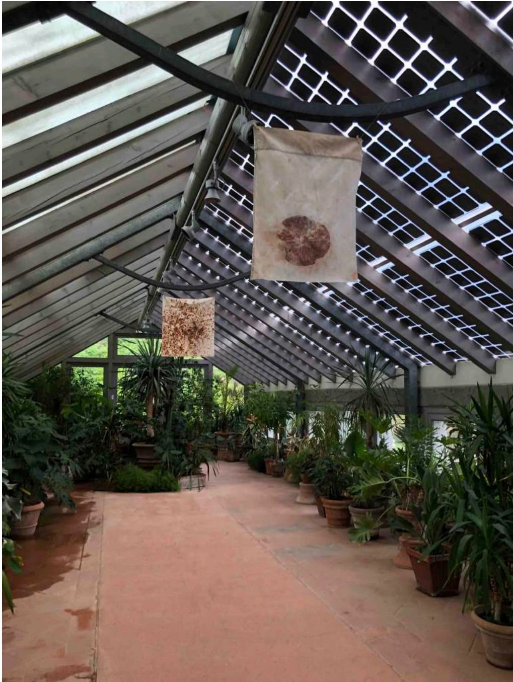
Francesco Geronazzo, Elementi naturali. Monotipia su tessuto. Installazione site-specific nella Serra Grande.