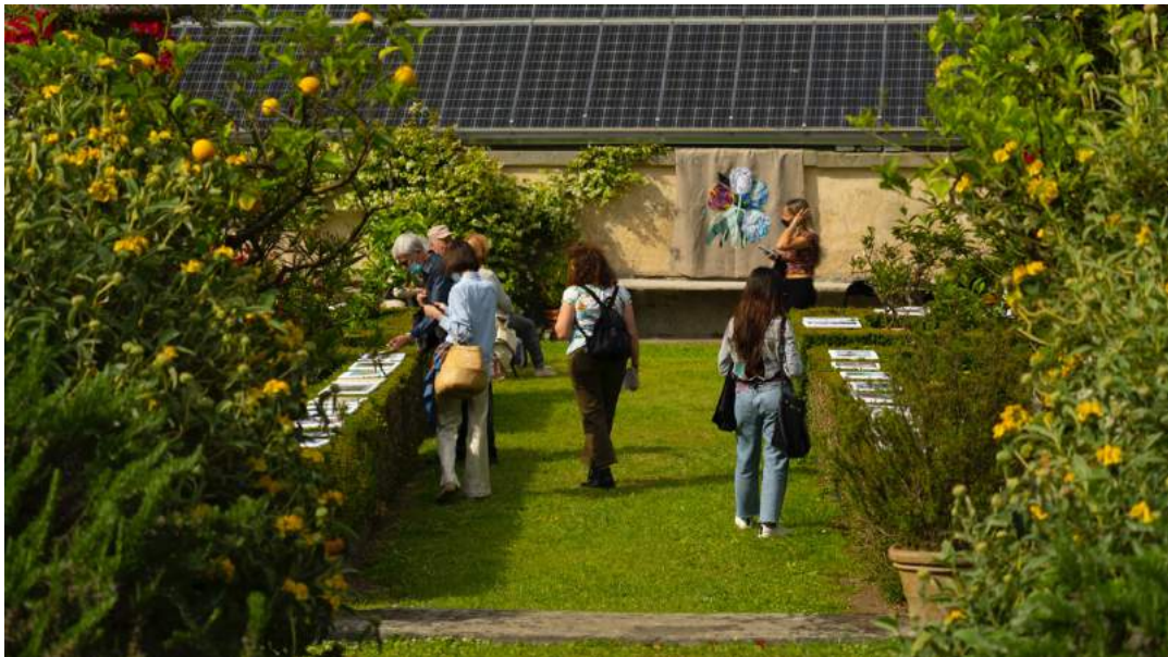
Silvia Zambarbieri, Tulipano gigante. Allestimento sul muro esterno della serra. Tecnica mista con materiali vari