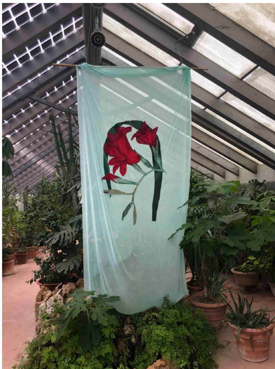
Silvia Zambarbieri, Il Giglio rosso, 2021. Opera in tecnica mista. Disegno, pittura, tessuti cuciti a mano. Fiore rosso in cotone, rami in cotone jacquard e raso verde su chiffon seta verde acqua