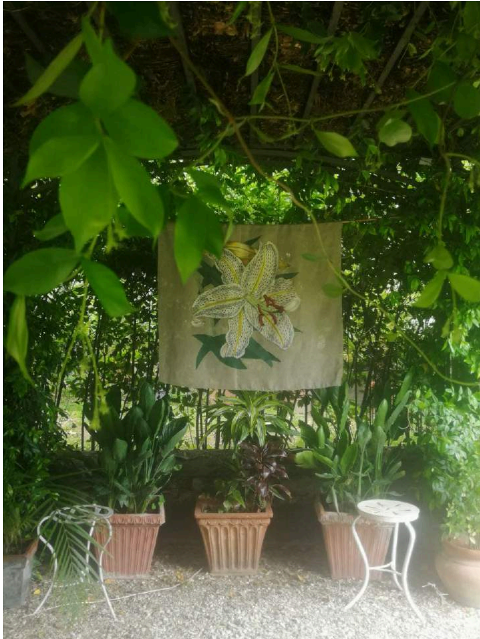
Silvia Zambarbieri, Giglio. Tecnica mista su tela, 2021 Fiore bianco in raso, cotone dipinto, foglie in cotone