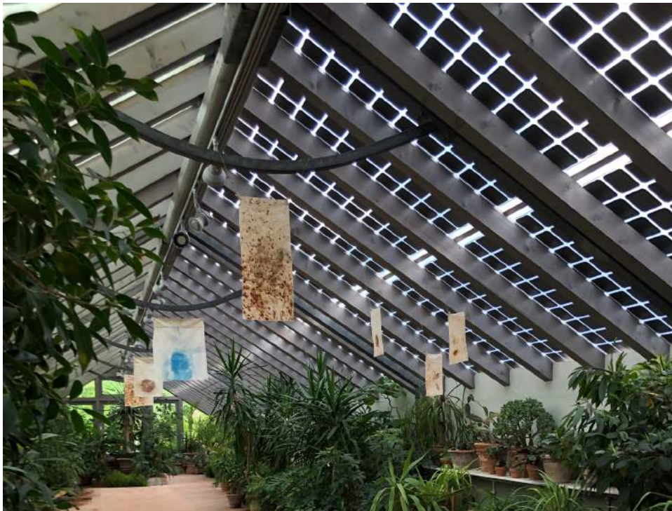
Francesco Geronazzo, Elementi naturali. Monotipia su tessuto. Installazione site-specific nella Serra Grande