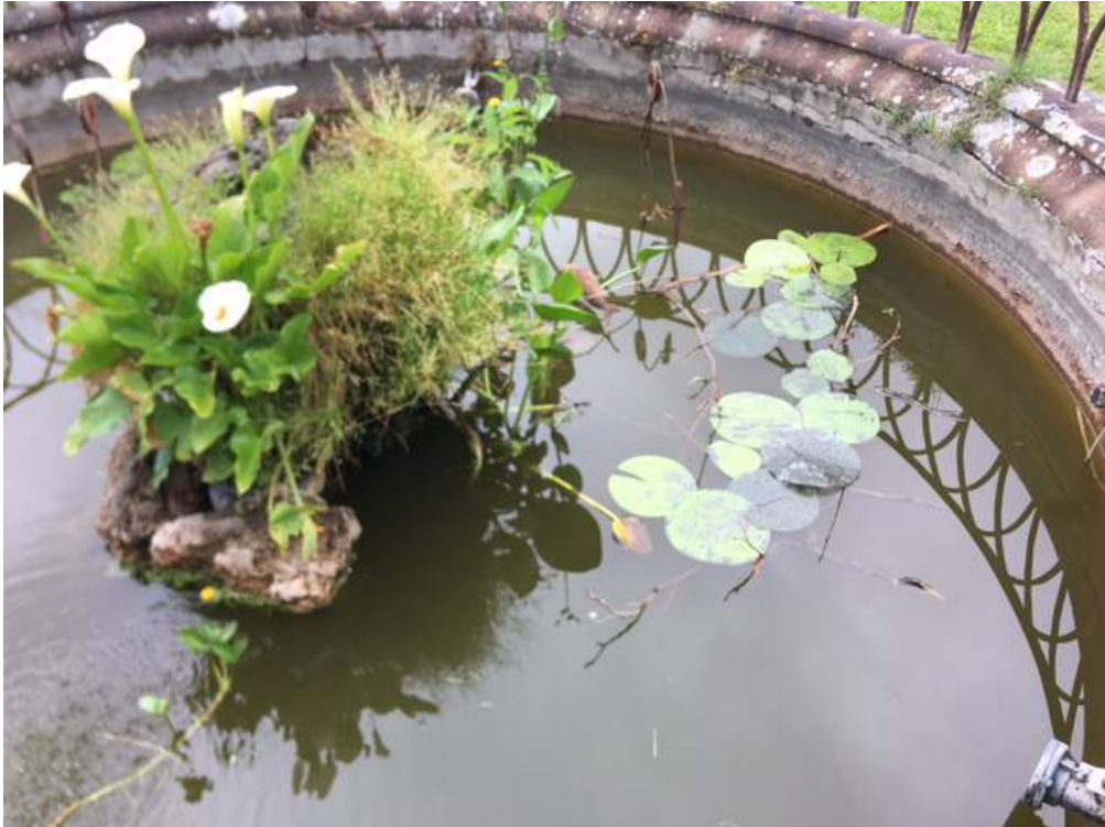
Francesco Geronazzo, Elementi naturali. Installazione site-specific nel Ninfeo.